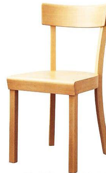
Die Abbildung entspricht nicht den geplanten Stühlen